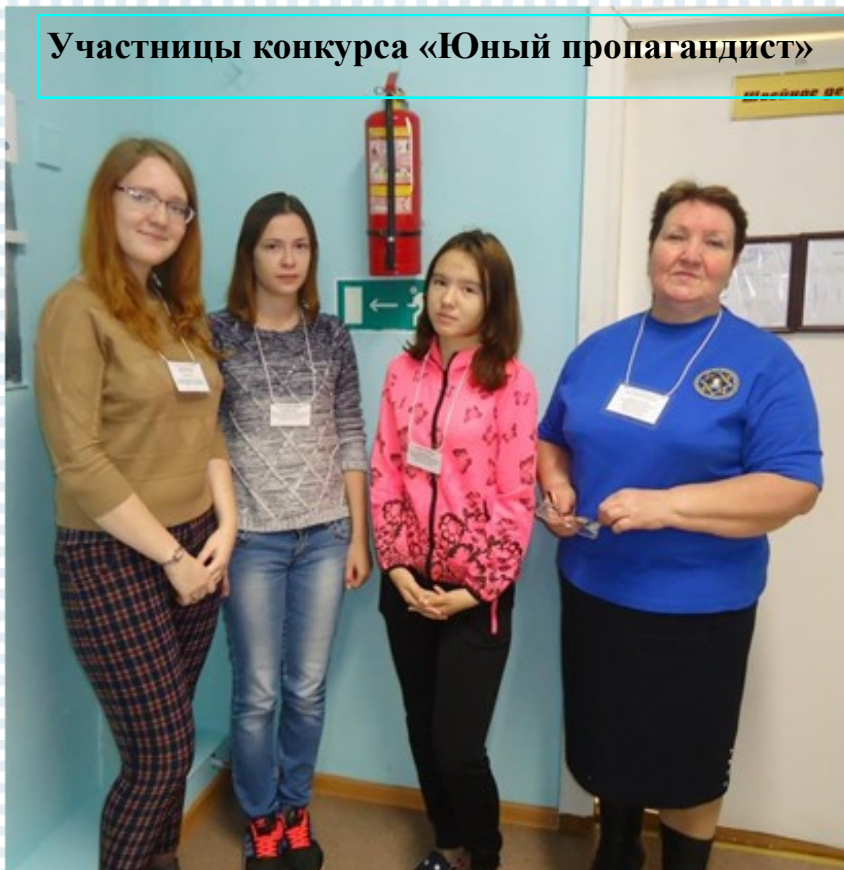
Участницы конкурса «Юный пропагандист»

Сегодня представляем вашему вниманию публикации участниц конкурса «Юный пропагандист-инструктор по пожарной безопасности» в газете «Ежeweek@» творческого объединения «Журналист» Игримского центра творчества.